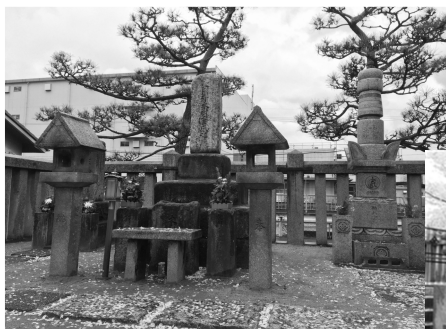
木村重成や家臣の墓がある公園になっている