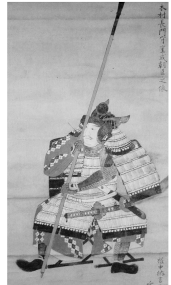
木村重成像 母は豊臣秀頼の乳母。真田丸の戦いに参加。大坂夏の陣で八尾・若江方面に出陣。墓は大阪府八尾市幸町の公園に。由来する地名として東大阪市若江南町1丁目には「若江木村通」という交差点がある。 webより

日時： 4月11日（火）9時半～12時過ぎまで 講師： 山本正典さん（悠々塾歴史コースリーダー） 集合場所： 若江岩田駅前希来里1階階段下 9時15分 雨天決行します 持ち物： 水筒など、天候に合わせた持ち物 参加費： 100円 申込： 3月末までに、めざめ事務所へ 電話、ファックス、メールなどで