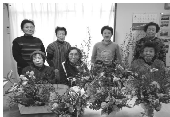
後列右から二人目が先生

従来の生け花は、空間のバランスを考えますが、フラワーアレンジメントは空間を花で埋めるので、多くの種類の花を使うのが特徴だとか。先生は貸農園で自分で栽培した花や、ご近所さんから頂く花木(足らずは購入)を材料にされています。