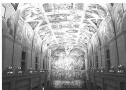
ミケランジェロ システィーナ礼拝堂天井画および壁画 ヴァティカン http://www.o-museum.or.jp/