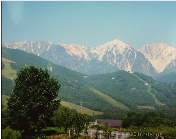
中部山岳国立公園 八方尾根 白馬連山