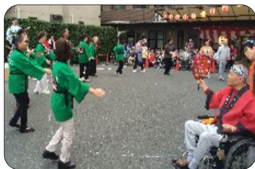
(ハッピー姿で踊るめざまめ会員)