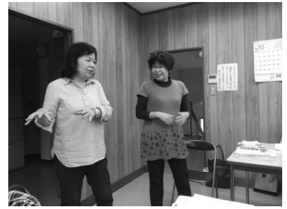
講師のお二人 これから始めます