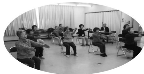
さくら体操教室の様子