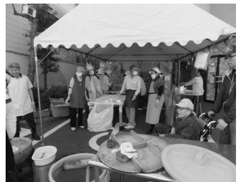
餡子をまるめ、蒸す上がるのを待つ

ビンゴゲームも行列ができるほどの人気。お昼には美味しいカレーもいただき、チョッと疲れたけれど2時には終了。楽しい経験ができました。(H.H.)