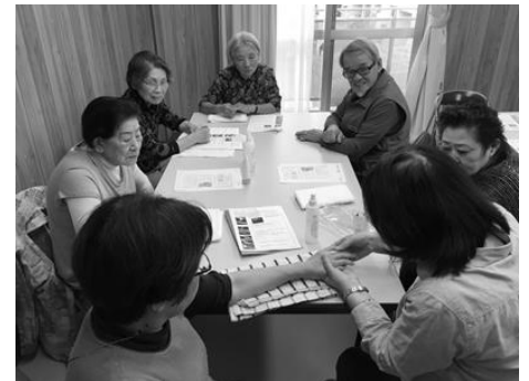
クリームなどを塗り、こんな風にマッサージしますと説明