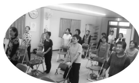
豊浦体操教室の様子