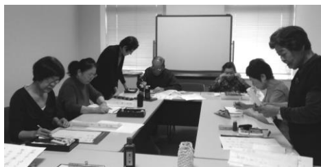
静寂なお稽古の様子