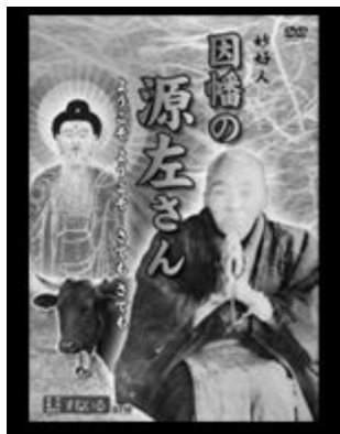
因幡の源佐さんとは 浄土真宗の教えを日常的 に体現した妙好人の一人