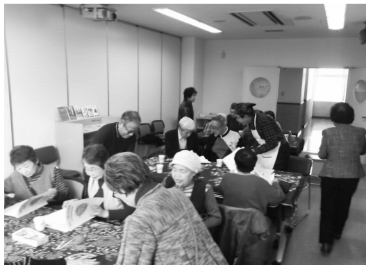
利用者でいっぱいの「出前サロン」の様子

いつもは、毎月第1、3土曜日にナルクめざめ事務所でやっている「おしゃべりサロン」ですが、希来里イコーラムフェスタに「出前サロン」として参加しました。いつものメンバーに加えて、久しぶりにお目にかかることのできた会員もおられ、たいへん話がはずんでいました。また、入ってはみたものの何をすればよいのか最初は戸惑われていた一般の方が、しばらくするとすっかりなじんで話をされている光景もみられました。