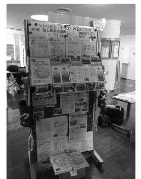
宣伝活動用のボードを片面使用させてもらい、三つ折りチラシや会報、新聞、写真など展示しました

参加者の感想から：、ホールで発表される「マジック」の方々も見てほんわかとした雰囲気でお話しできました。集まることの大切さを感じました。(T.T.)