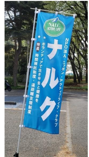
この旗の下に集まれ