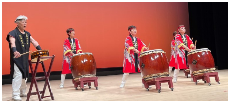
街かどメンバーも入っての、「祝い太鼓」 第2部開始に弾みをつけてくださいました