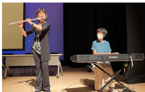
リプル=フルートとピアノのデュオ 来場者に素晴らしい音楽を提供してくださいました