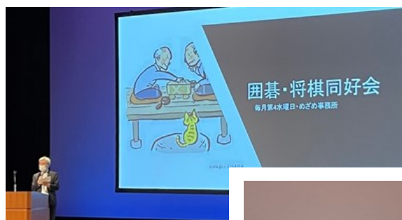
堂前顧問は「王将」を 熱唱して発表されま した

同好会 囲碁将棋、めざまし 会報紙がお手元に届くまでの パワーポイントや、卓球 同好会のダンスと工夫を凝 らしてのパフォーマンスが 発表、披露されました