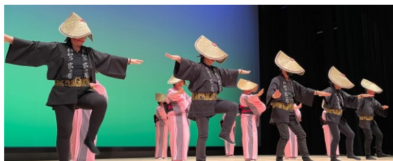
越中おわら節を踊っていただきました