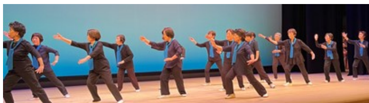
太極拳 「街かど」でいっぱい練習しました