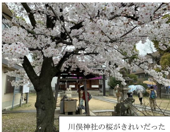
川俣神社の桜がきれいだった