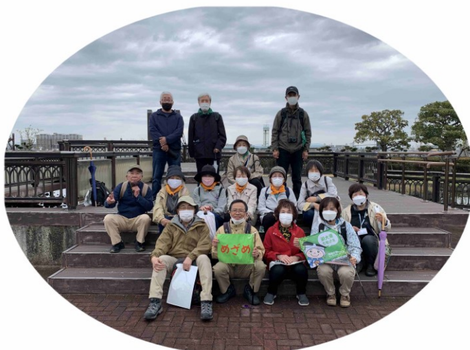
水みらいセンター・スカイランドにて