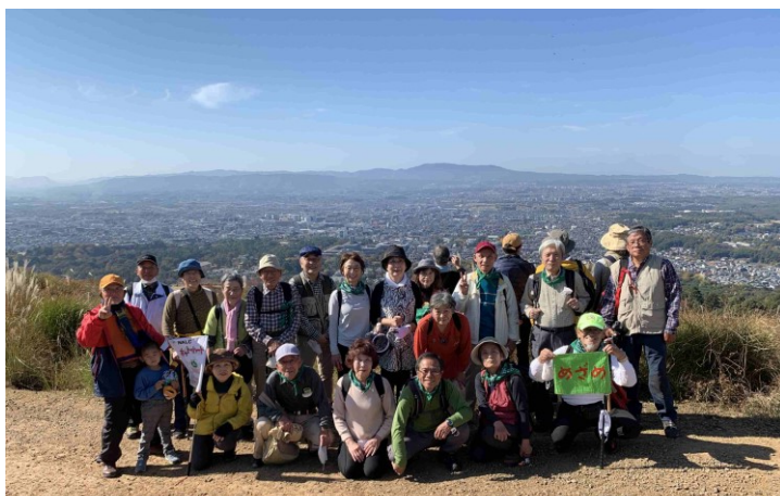
ナルク奈良拠点の会員さんに出会い一緒に写真を撮る。若草山頂上の三重目まで、たくさんの階段を一生懸命に上りました。