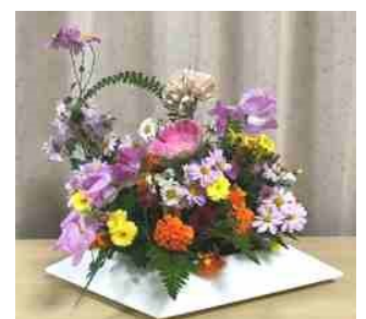
アレンジフラワー