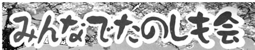
街かどデイハウス予定表 (1/16~2/15)