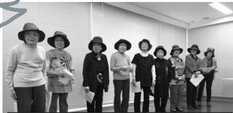
水曜、製作の帽子披露と川柳他