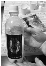
春日神社のお神酒は ペットボトルに

2019年の事務所開きには、10名の参加がありました。それぞれが持ち寄った飲み物をいただきながら、小さい頃の思い出話から国際的な話まで、笑いがいっぱいの楽しいひとときを過ごしました。手作りの食べ物もあり、美味しくいただきました。善根寺の春日神社のお神酒（どぶろくのようなもの）も頂き、気持ち新たに前向きに今年を過ごそうと誓いました。