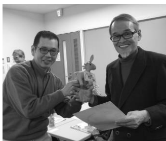
ロバとステッカーを受け取る めざめ事務所玄関にあります

最近行方不明になる人も増えてきています。認知症かなと相談されたら、ご自分のお住まいの地域包括支援センター認知症相談窓口へ繋いであげてください。 (K)