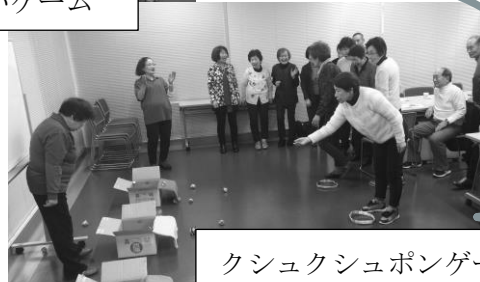
クシュクシュポンゲーム