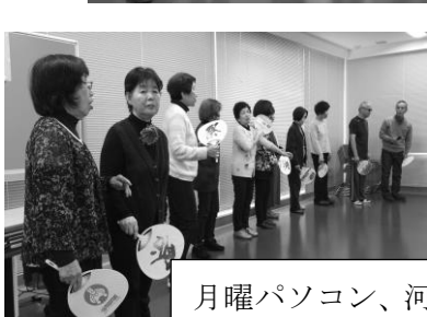
月曜パソコン、河内音頭(まめかち)