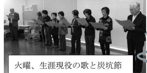
火曜、生涯現役の歌と炭坑節