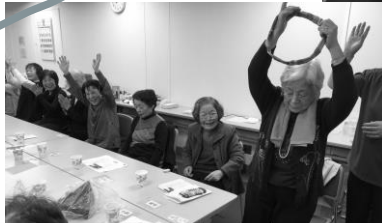
新聞輪くぐり、うちが一番