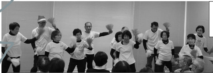
月曜マーじゃん、365歩のマーチ振り付けて歌う