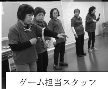
ゲーム担当スタッフ