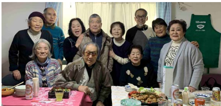
事務所開きの午前の部に集まった方々。今年もよろしく

食べ物を用意して下さった方、飲物を持参の方、杯を重ねながら楽しくお話ができました。新しい年もそれなりの力で楽しく元気に生き抜きましょう。よろしく願いいたします。